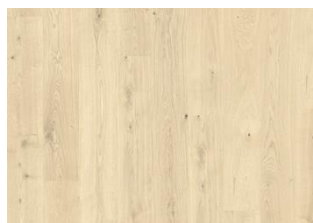
Bwindi CLA 200