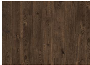
Rocky CLA 200