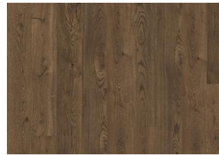
Smoky CLA 200