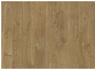
Serengeti CLA 200