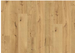
Grand Canyon CLA 200