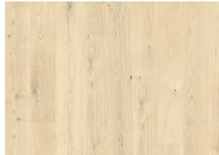
Bwindi CLA 200