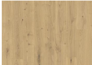
Kappadokien CLA 200