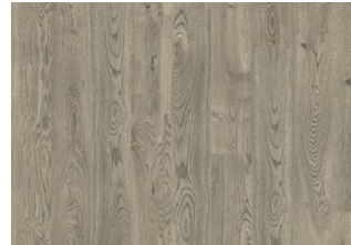
Jasper CLA 200