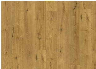
Yosemite CLA 200