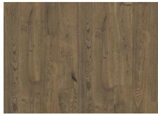
Yellowstone CLA 200