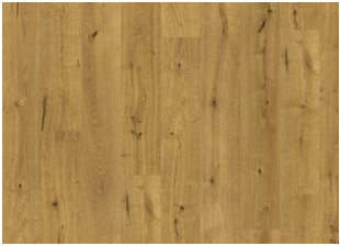
Yosemite CLA 200