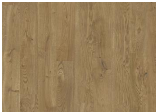
Serengeti CLA 200