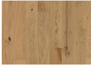
EICHE ASTER MATTLACKIERT