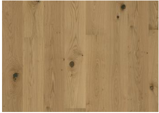
EICHE ASTER GEÖLT