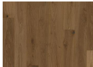
EICHE ALP ROSE