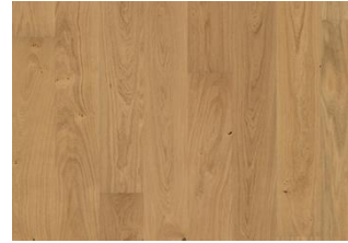
EICHE DAHLIA GEÖLT