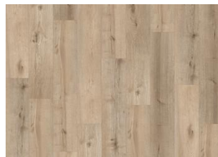
Sabiano CLW 228