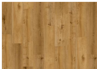
Overo CLW 228