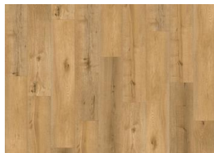
Tobiano CLW 228