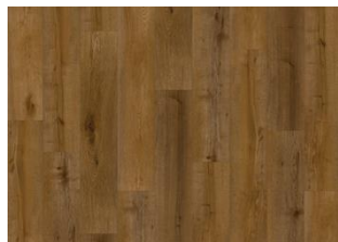
Marrone CLW 228