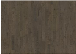
Charcoal Light Strip