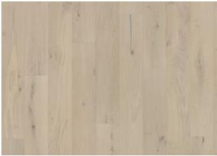
Chêne Loft White Plank