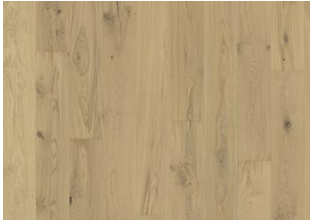
Chêne Urban Brown Plank