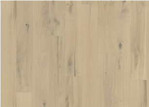
Chêne Frosted Oat Plank