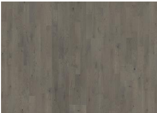
Pearl Grey Strip