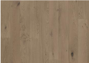
Chêne Frozen Hazelnut Plank