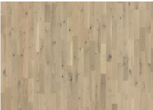
Frosted Oat Strip