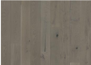
Pearl Grey Plank