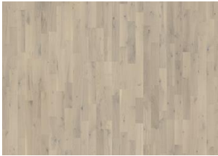
Loft White Strip