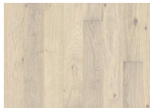
Rovere Nouveau Blonde