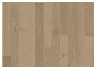
Rovere Nouveau White