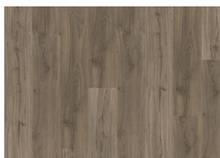
Kelham - 6 mm Impression Rigid Click