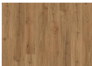
Sumava - 6 mm Impression Rigid Click