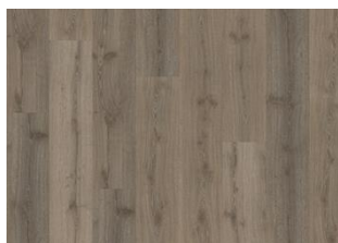
Spreewald - 6 mm Impression Rigid Click