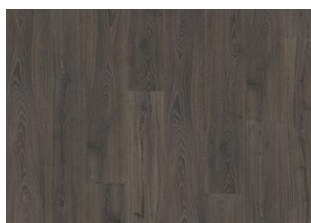
Odenwald - 6 mm Impression Rigid Click