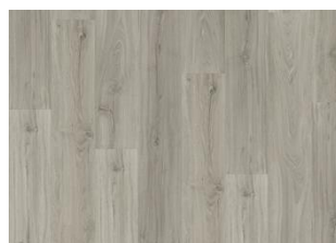
Laponia - 6 mm Impression Rigid Click