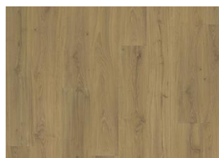
Foxall - 6 mm Impression Rigid Click