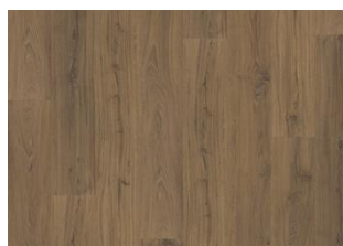
Saham - 6 mm Impression Rigid Click