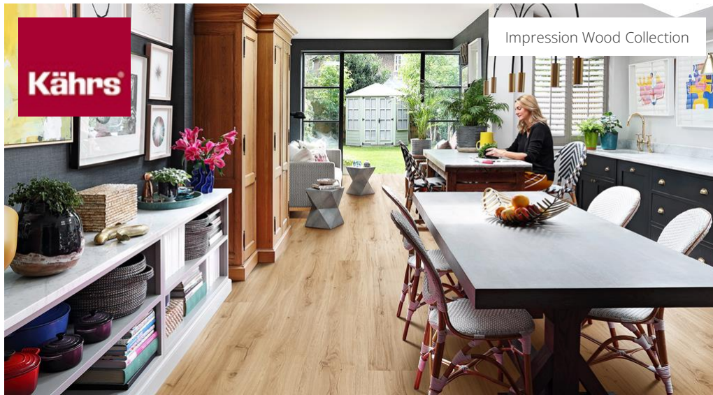
Impression Wood Collection