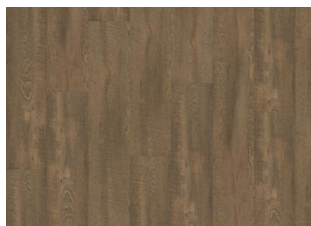
Durmitor - Dry back