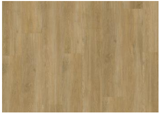
Sapo - Dry Back