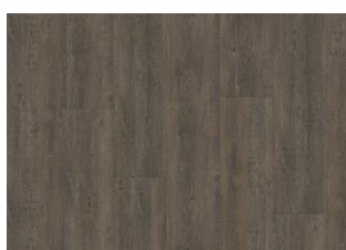
Gorbea - Dry back