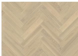
CHÊNE BÂTON ROMPU AB CRÈME BLANC