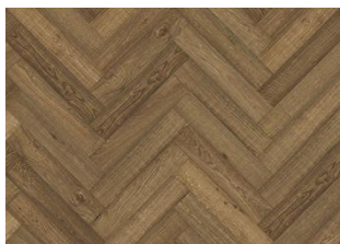
BÂTON ROMPU CHÊNE CD VINTAGE SMOKED