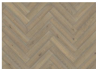
BÂTON ROMPU CHÊNE CC VINTAGE BLANC