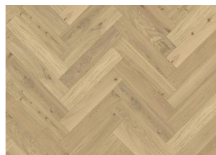
BÂTON ROMPU CHÊNE CC DIM BLANC