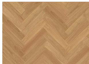
CHÊNE BÂTON ROMPU AB