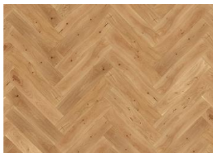
BÂTON ROMPU CHÊNE CD