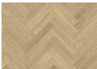
BÂTON ROMPU CHÊNE AB DIM BLANC