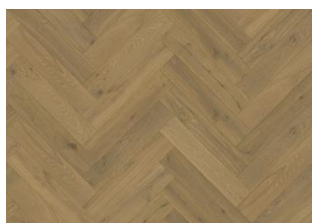
BÂTON ROMPU CHÊNE CD GRIS