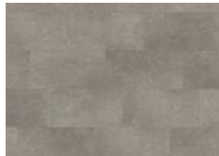
Lucania - 6 mm lakkopontillinen