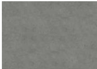
Makalu - 6 mm lakkopontillinen