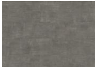
Kebnekaise - 6 mm lakkopontillinen