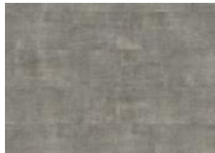
Matterhorn - 6 mm lakkopontillinen