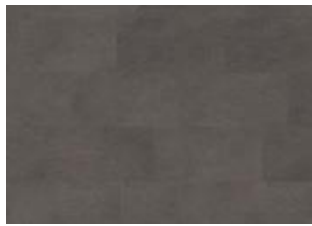
Kilimanjaro - Click 6 mm