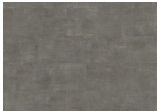
Kebnekaise - 6 mm lakkopontillinen