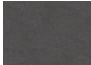
Schwarzhorn - 6 mm lakkopontillinen