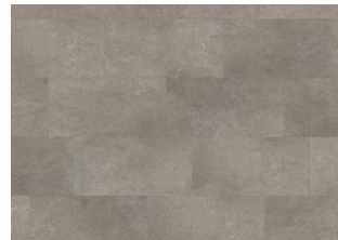
Lucania - 6 mm lakkopontillinen