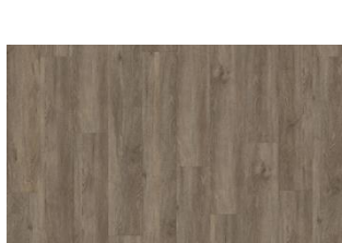
Sarek - 5 mm lukkopontillinen