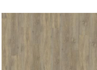
Taiga - 5 mm lukkopontillinen