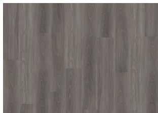
Wentwood - 5 mm lukkopontillinen