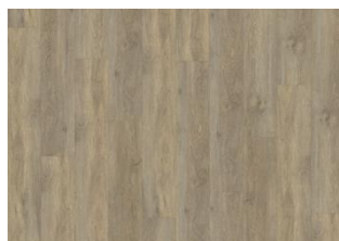
Taiga - 5 mm lukkopontillinen