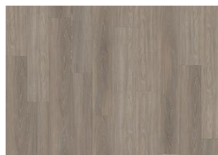
Whinfell - 5 mm lukkopontillinen