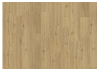
Oulanka - 5 mm lukkopontillinen