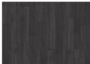
Schwarzwald - 5 mm lukkopontillinen