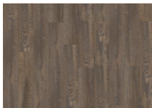
Kannur - 5 mm lukkopontillinen