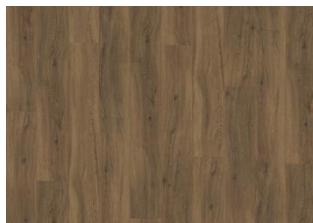
Redwood - 5 mm lukkopontillinen