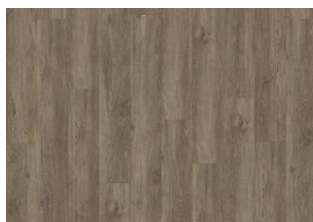
Sarek - 5 mm lukkopontillinen