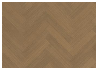
EG SAGE SILDEBEN