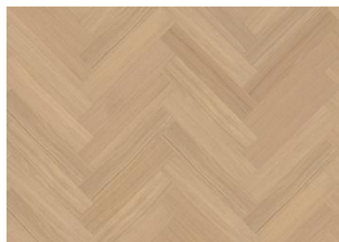
EG GINSENG SILDEBEN