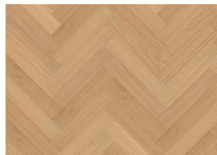
EG CHAMOMILE SILDEBEN