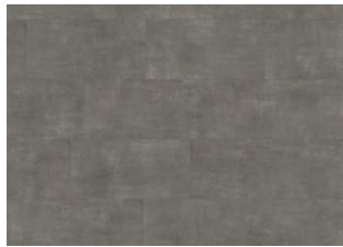
Kebnekaise - 6 mm lakkopontillinen