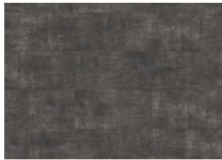
Steele - 6 mm lakkopontillinen