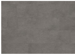
Grossglockner - 6 mm lakkopontillinen