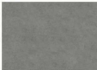
Makalu - 6 mm lakkopontillinen