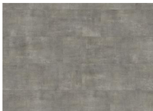
Matterhorn - 6 mm lakkopontillinen