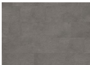
Grossglockner - Click 6 mm