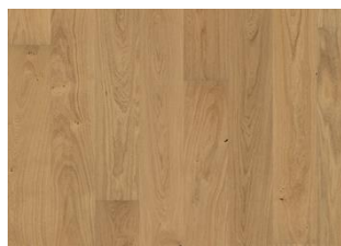
EICHE DAHLIA mattlackiert