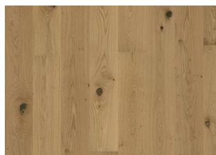
Eiche Aster Naturgeölt