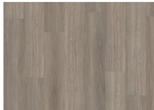
Whinfell - 6 mm lukkopontillinen