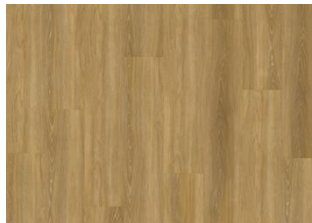
Fontin - 6 mm lukkopontillinen