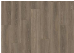
Tiveden - 6 mm lukkopontillinen