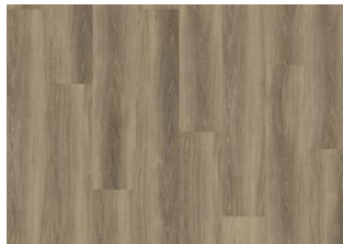
Hanmer - 6 mm lukkopontillinen