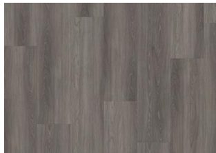
Wentwood - 6 mm lukkopontillinen