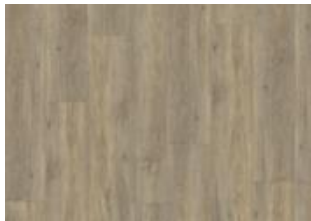
Taiga - 6 mm lukkopontillinen