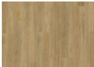
Sapo - 6 mm lukkopontillinen