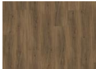
Redwood - 6 mm lukkopontillinen