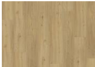
Oulanka - 6 mm lukkopontillinen