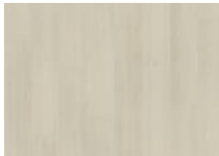
Aspen - 6 mm lukkopontillinen