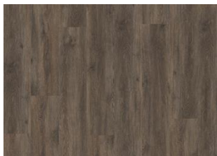
Saxon - 6 mm lukkopontillinen