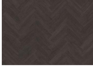
Valdivian - Dry Back Herringbone