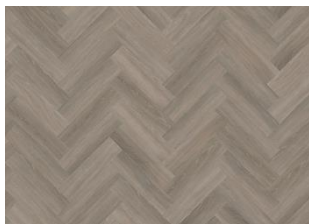
Whinfell - Dry Back Herringbone