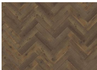
Komi - Alustaan liimattava Herringbone