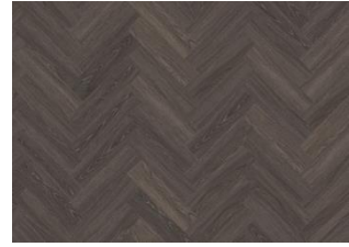
Tongass - Dry Back Herringbone