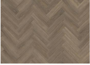
Tiveden - Dry Back Herringbone