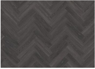
Calder - Dry Back Herringbone