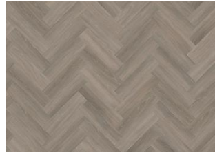
Whinfell - Dry Back Herringbone