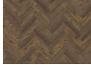
Komi - Dry Back Herringbone