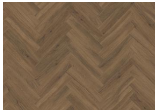
Redwood - Dry Back Herringbone