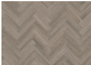
Whinfell - Dry Back Herringbone