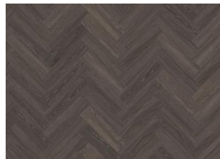
Tongass - Alustaan liimattava