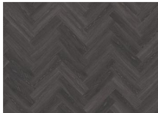
Calder - Dry Back Herringbone