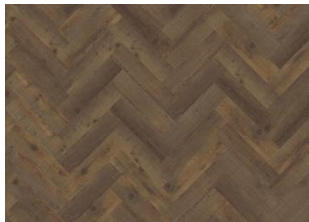
Komi - Alustaan liimattava Herringbone