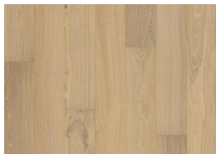
Oak Paris ultramatt