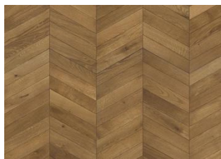
Eik Chevron Light brown