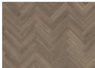
Tiveden - Dry Back Herringbone