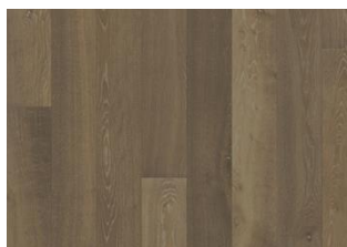
Eiche Nouveau Greige