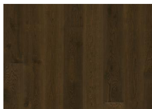
Eiche Nouveau Tawny