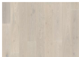
Eiche Nouveau Snow