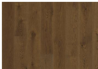
Eiche Nouveau Rich