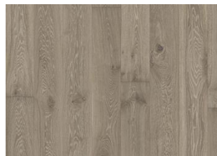
Eiche Nouveau Gray