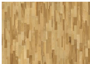
SAARNI KALMAR MATT