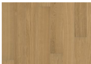
Rovere Piazza AB