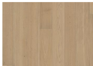
Piazza Rovere AB Bianco 11 mm