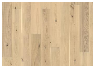
Piazza Oak CD White Sawmarks