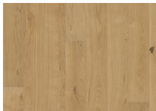
Piazza Rovere CD