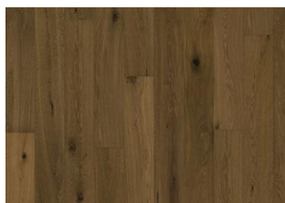
Piazza Rovere affumicato CD 11 mm