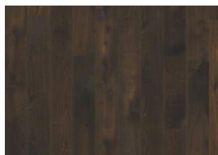
Piazza Rovere affumicato CD 11 mm