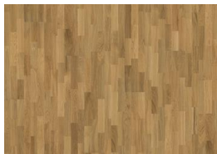
EG SIENA SATIN