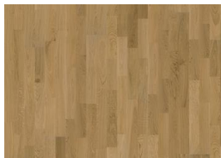
EG VERONA MATT