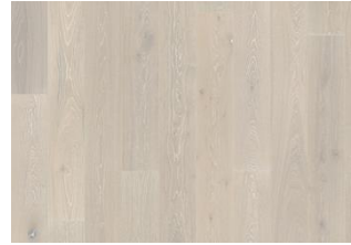
Eiche Nouveau Snow