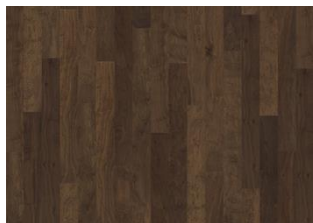
Noce americano Orchard