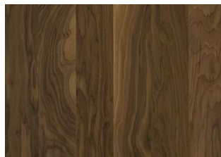
Noce americano Garden