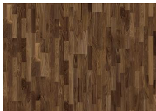
Walnuss amerik. Montreal