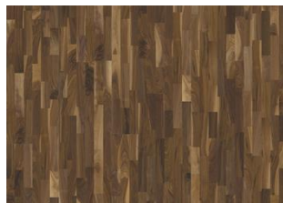
Walnuss amerik. Hartford