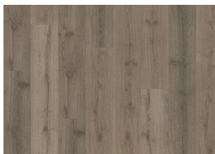
Spreewald - 6 mm Impression Rigid Click