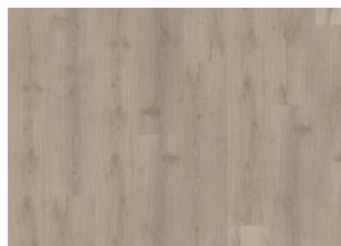
Dovecot - 6 mm Impression Rigid Click