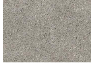
Aneto - 6 mm Impression Rigid Click