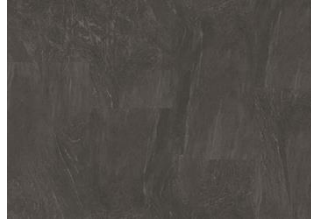
Amaro - 6 mm Impression Rigid Click