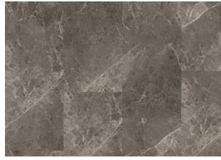
Ultar - 6 mm Impression Rigid Click