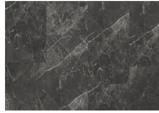
Talung - 6 mm Impression Rigid Click