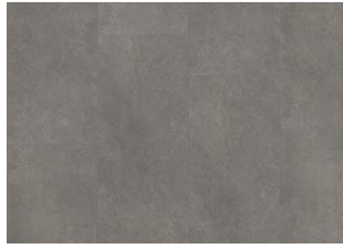
Grossglockner - 6 mm Impression Rigid Click