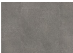
Grossglockner - Click 6 mm Impression