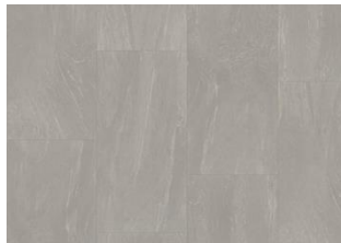
Athos - 6 mm Impression lukkopontillinen