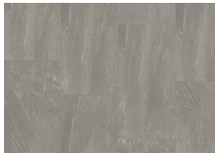
Olympus - 6 mm Impression lukkopontillinen