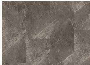
Ultar - 6 mm Impression lukkopontillinen