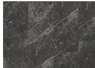
Talung - 6 mm Impression lukkopontillinen