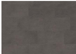
Kilimanjaro - 6 mm Impression lukkopontillinen