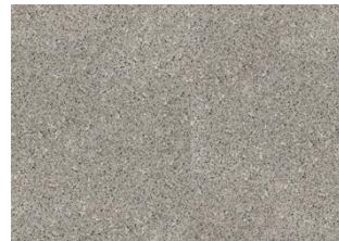
Aneto - 6 mm Impression lukkopontillinen