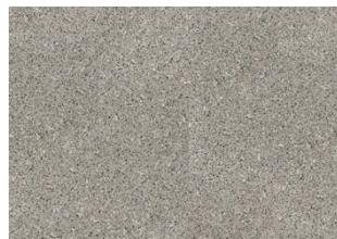
Aneto - Click 6 mm Impression