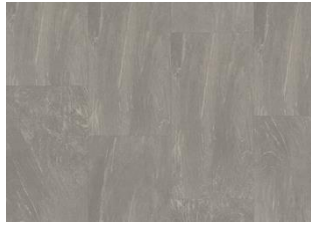
Olympus - 6 mm Impression Rigid Click