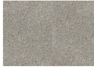
Aneto - 6 mm Impression Rigid Click