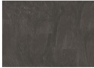
Amaro - 6 mm Impression Rigid Click