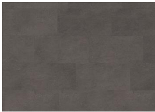
Kilimanjaro - 6 mm Impression Rigid Click