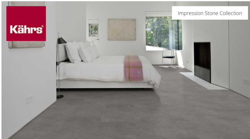
Impression Stone Collection