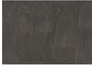
AMARO CLICK XXL