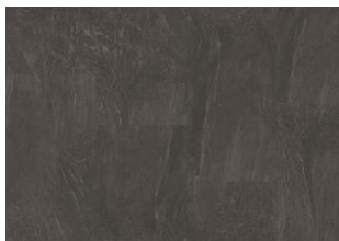
Amaro - Click 6 mm Impression