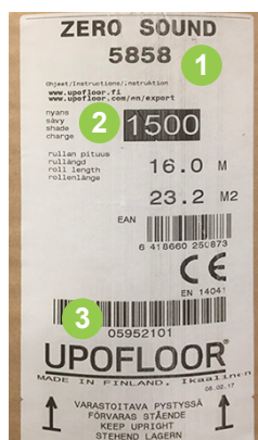
Beispiel Etikett auf der Bahnenware Zero Sound mit (1) Farb-, (2) Chargen- und (3) Rollen-Nr.

Bei der Verlegung von Bahnen und Fliesen in einem Raum, dürfen nur chargengleiche Waren aus einer Fertigung verlegt werden. Bei der Bestellung ist darauf zu achten, dass Chargen und farbgleiches Material bestellt werden. Leichte Farbverläufe sind innerhalb einer Charge jedoch möglich.