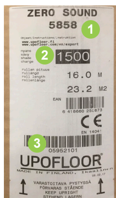
Etikett auf der Bahnenware Zero Sound mit (1) Farb-, (2) Chargen- und (3) Rollen-Nr.

Bei der Verlegung von Bahnen und Fliesen in einem Raum, dürfen nur chargengleiche Waren aus einer Fertigung verlegt werden. Bei der Bestellung ist darauf zu achten, dass Chargen und farbgleiches Material bestellt werden. Leichte Farbverläufe sind innerhalb einer Charge jedoch möglich.